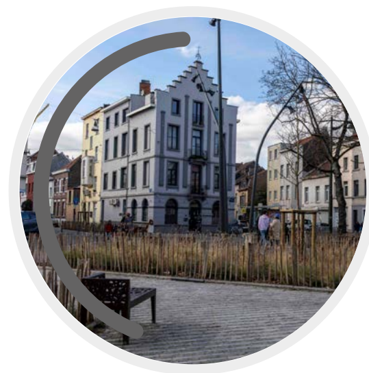
Rénovation des rues et d'une place dans le quartier Scheut à Anderlecht