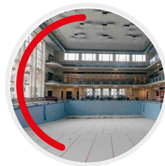
L'échafaudage de trois étages à la piscine Neptunium a été retiré