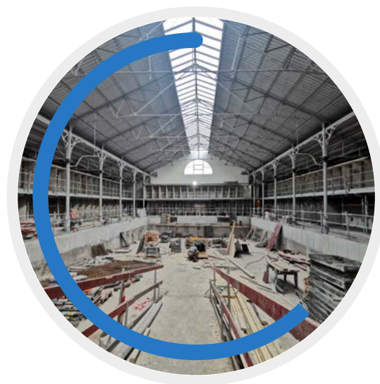
Travaux de stabilité et de structure pour la piscine d'Ixelles