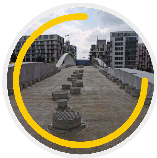
Placement de la travée principale du pont Suzan Daniel au-dessus du canal Anvers-Bruxelles-Charleroi